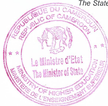
Jacques FAME NDONGO

Le Ministre d'Etat, Ministre de l'Enseignement Supérieur The State Minister, Minister of Higher Education